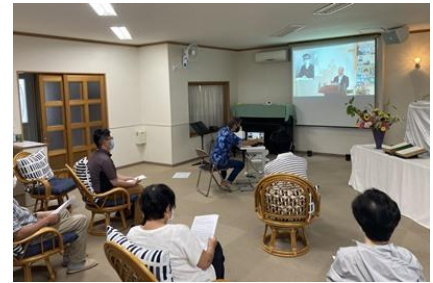
間隔を保って参加します

コロナを機に、zoom によるオンライン講演会が東京と北見市の有志により発足。講師は旭川市と、所沢市の書齋から講演を発信。私たちは碧南にいながらにして、全国各地域の三浦綾子読書会メンバーと、講演を共有しています。