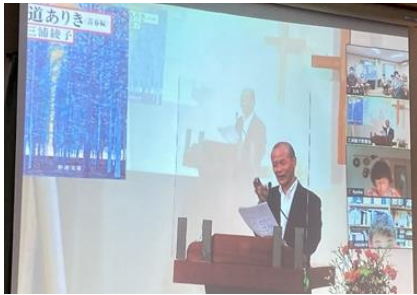
オンライン講演会

コロナを機に、zoom によるオンライン講演会が東京と北見市の有志により発足。講師は旭川市と、所沢市の書齋から講演を発信。私たちは碧南にいながらにして、全国各地域の三浦綾子読書会メンバーと、講演を共有しています。